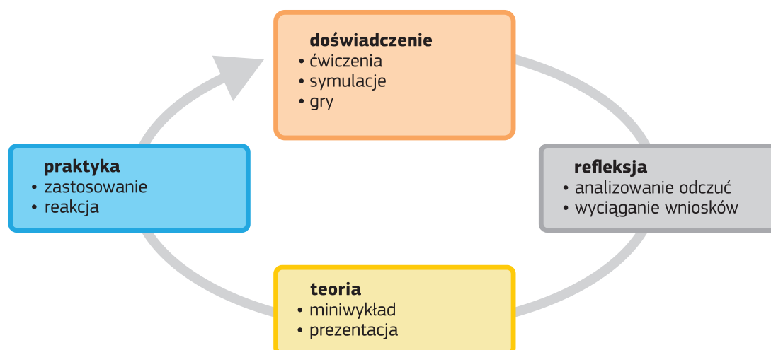
Ryc. 1. Cykl Davida A. Kolba.

Każdy warsztat można zaprojektować jako proces służący pogłębianiu świadomości i poszerzaniu wiedzy, nauce lub doskonaleniu umiejętności, zmianie postaw osób uczestniczących. Warto zwrócić uwagę nauczycielom, że przed rozpoczęciem warsztatu powinni zastanowić się i podjąć decyzję, czy warsztat będzie działaniem jednorazowym, punktowym (i wtedy należy postawić przed sobą cele związane na przykład z pogłębieniem wiedzy na wybrany temat lub rozwijaniem jakiejś umiejętności, choćby reagowania na przejawy uprzedzeń), czy mamy szansę na regularną pracę z daną grupą. W takiej sytuacji warsztaty będą miały charakter cykliczny, będą dłuższym procesem, dzięki któremu będzie możliwa zmiana postaw (np. w klasie istnieje problem wykluczenia lub hejtu, gorszego traktowania kogoś z grupy).